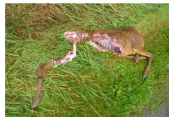
Spist af Ulv nær Egtved